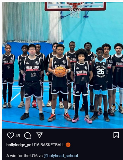
hollylodge_pe U16 BASKETBALL A win for the U16 vs @hollyhead_school

Well done! | ਬਹੁਤ ਖੁਸ਼ | ਸਾਬਾਸ | بت اچھے