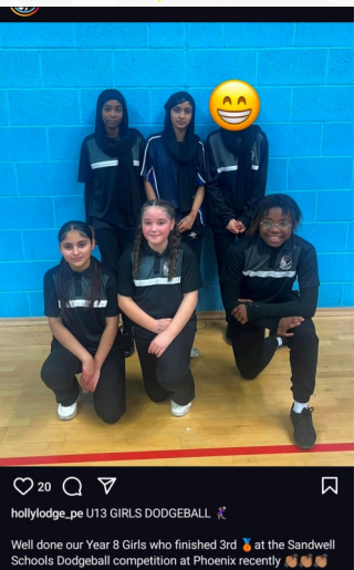
hollylodge_pe U13 GIRLS DODGEBALL Well done our Year 8 Girls who finished 3rd at the Sandwell Schools Dodgeball competition at Phoenix recently 🏆👏