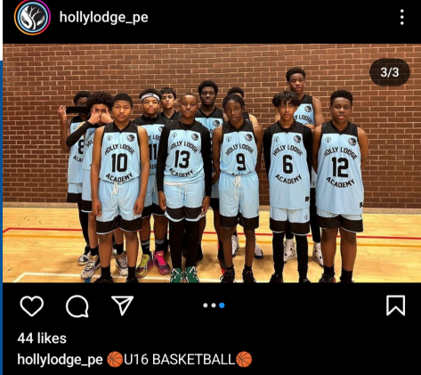
44 likes hollylodge_pe 🏀 U16 BASKETBALL 🏀

Today our U16 side travelled to Nunery Wood High School. Not the result we wanted but we have definitely seen an improvement in our game play!