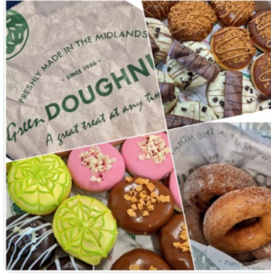
1:56 PM · May 13, 2022 · Twitter for Android