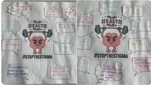
9:49 AM · May 19, 2022 · Twitter Web App

HollyLodge_B67 @HollyLodge_B67 Some lovely pieces of work for #MentalHealthAwarenessWeek last week #StopTheStigma