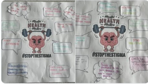
9:49 AM · May 19, 2022 · Twitter Web App

HollyLodge_B67 @HollyLodge_B67 Some lovely pieces of work for #MentalHealthAwarenessWeek last week #StopTheStigma