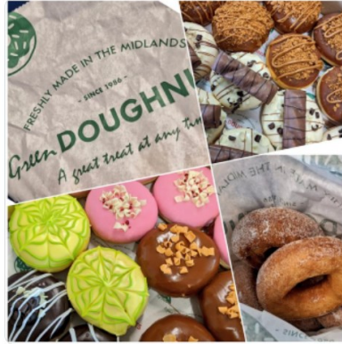
1:56 PM · May 13, 2022 · Twitter for Android